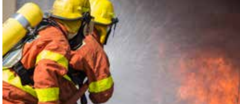
Brandweershervorming zorgt voor extra kosten p.2