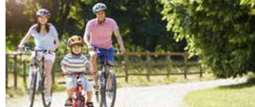
Veel Vlaams geld voor Balense fietspaden p.3