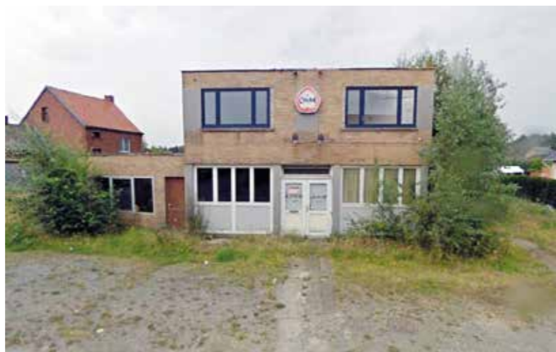
We betreuren dat het bestuur geen verdere stappen neemt tegen de langdurige leegstand en de situatie laat zoals ze is.

Volgens de N-VA zorgt een heffing ervoor dat eigenaars die niet zelf in het gebouw gaan wonen sneller de stap zetten naar de verhuurmarkt of verkoop. Daardoor blijven panden niet leegstaan tot ze verkrotten. Het aantal beschikbare huurwoningen zou daardoor mogelijk toenemen.